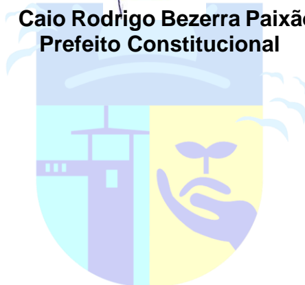
Caio Rodrigo Bezerra Paixão Prefeito Constitucional

Gabinete do Prefeito Constitucional do Município de Condado, Estado da Paraíba, 24 de novembro de 2025.